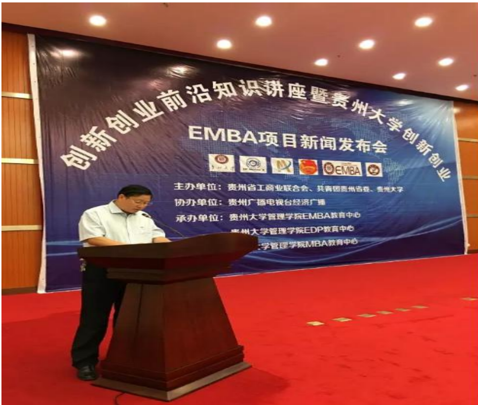
贵州省工商业联合会党组书记肖向阳致辞