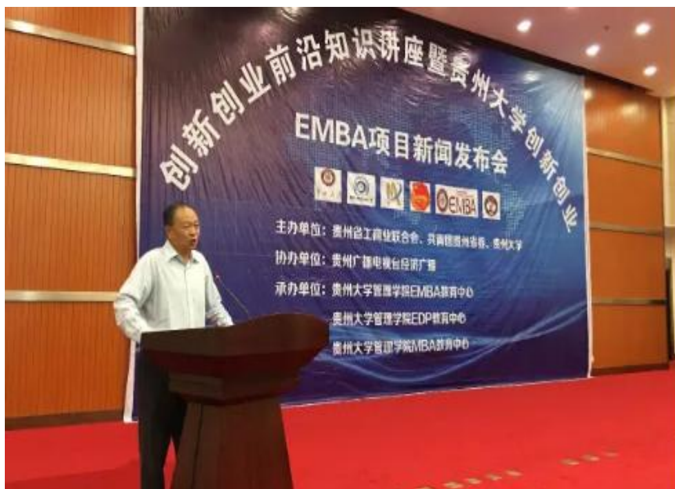
贵州省政协副主席、贵州大学管理学院名誉院长国强致辞并做大会演讲