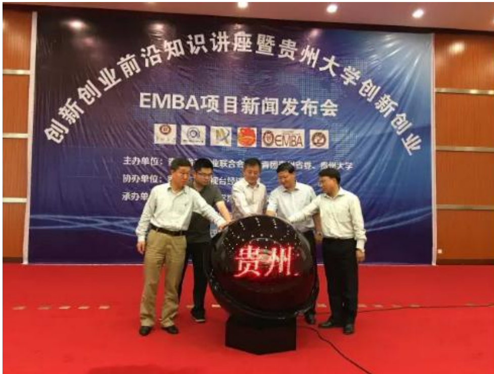
贵州大学创新创业 EMBA 项目正式启动

“贵州大学创新创业 EMBA 项目”旨在培养“创新领导力”，围绕“创造、创新、创业”的理念，针对 30-45 岁的创新精英、创业新锐及其企业成长需求设置前瞻性、创新性、实战型的系统课程。致力于培养“有创新思想、有创业精神、贡献管理智慧、引领社会经济发展”的中青年创业者。项目启用全新 EMBA 的课程体系，凝练贵大特色，新设“创新、创业、大数据、互联网 +”以及“阳明文化与人文素养”模块，结合黔中优势，融合创新创业背景，以综合性大学的学术研究和知识创造为核心、搭建创新的课程体系，为贵州培养最优秀的创新创业杰出人才。