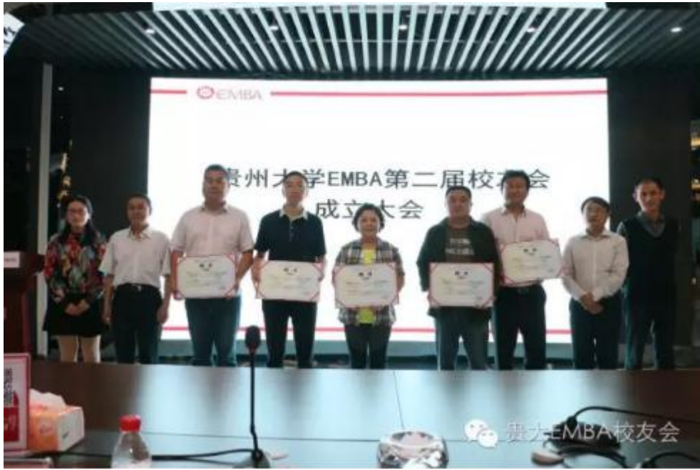
贵州大学管理学院领导为贵州大学 EMBA 第二届校友会副会长颁发聘书