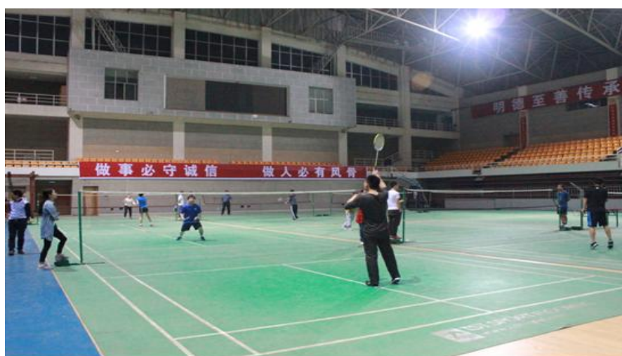
图 1-1 MBA2015 级迎新羽毛球赛场

2015 年 10 月 23 日晚，在贵大北校区体育馆举办了 2015 级迎新羽毛球赛，中心的老师和同学们在激烈地比赛中，积极拼搏，赛出了水平和风格；各参赛队员得到了良好的锻炼，增进了友谊，取得了良好成绩，MBA2015 级迎新羽毛球赛取得圆满成功。