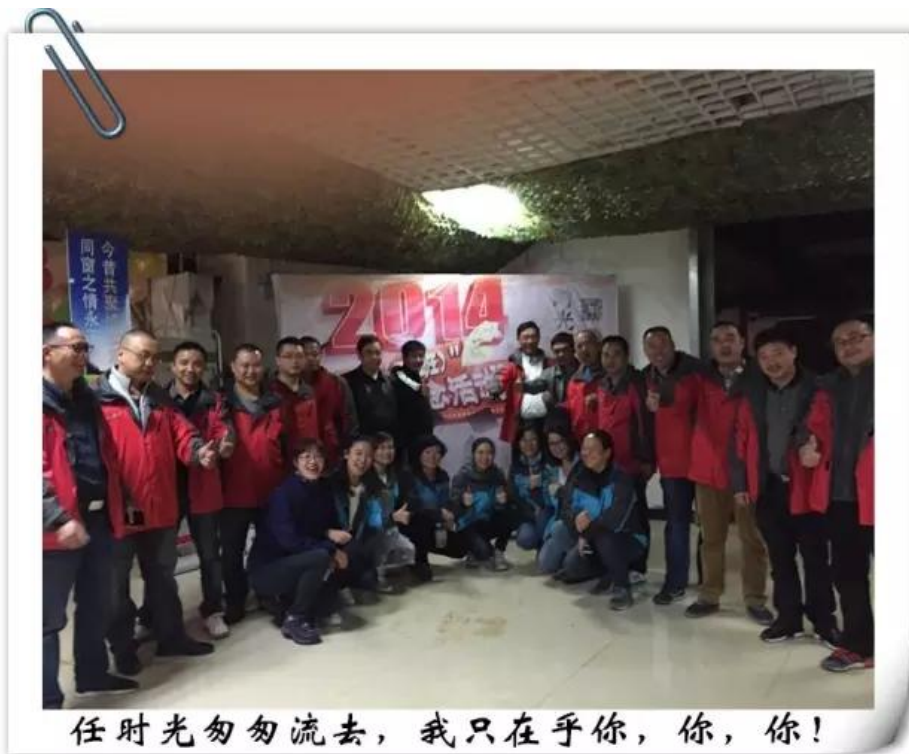
任时光匆匆流去，我只在乎你，你，你！