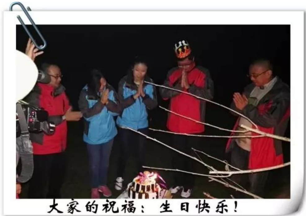
大家的祝福：生日快乐！