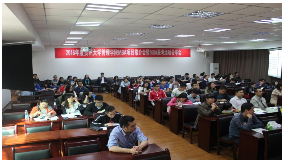
图 1-2 MBA 项目推介会暨联考经验分享会会场