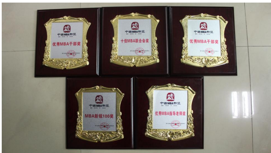
图 1-2 贵大 MBA 联合会获奖奖牌