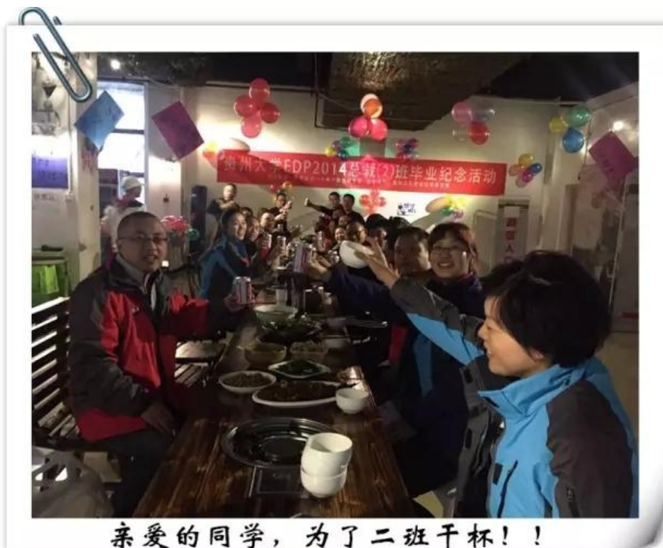
亲爱的同学，为了二班干杯！！