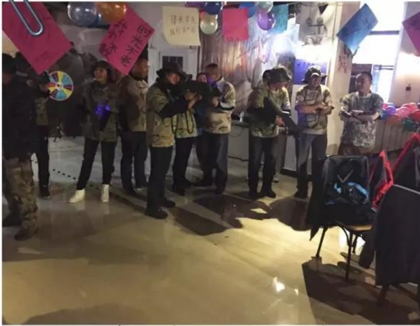
全员整装待发！集体协作！