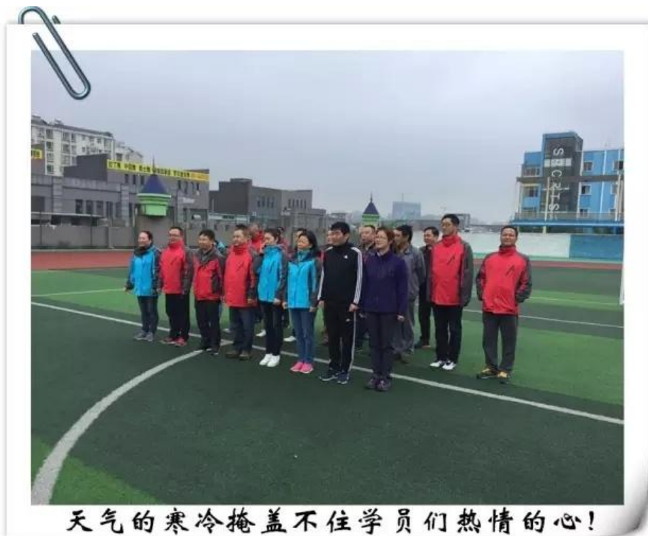
天气的寒冷掩盖不住学员们热情的心!