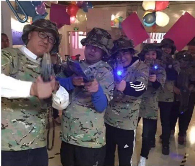
我们是如风的少年！